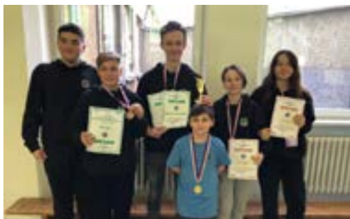
Celá naše úspěšná výprava na závodech v Karviné