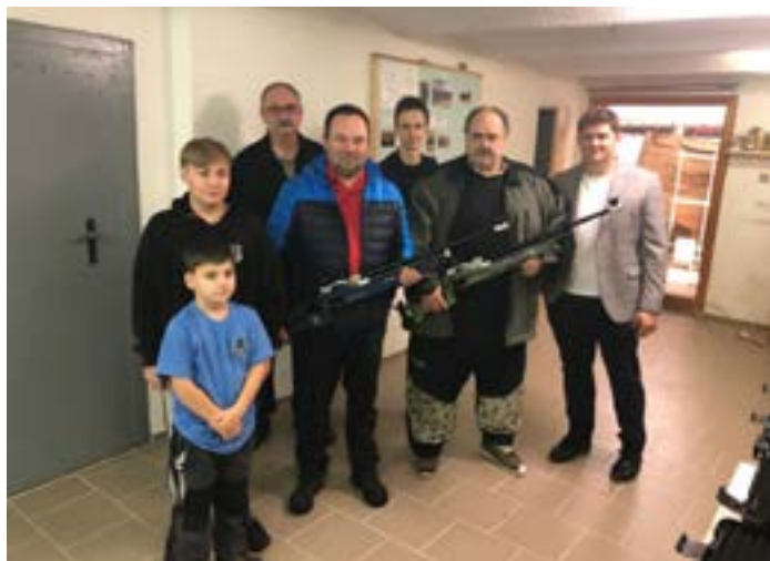
Naše nové zbraně zn. Walther se sponzory