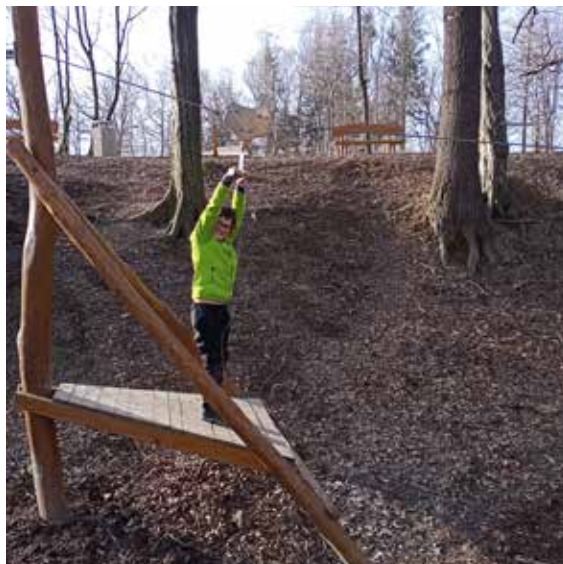
Dobratický Lesopark (nahore)

Jaro je už tady, přibývá slunečných dnů a my pro Vás máme dvě místa, kam vyrazit na výlet. V Dobraticích loni na podzim otevřeli Lesopark. Není to jen lesík, kde si děti mohou hrát, ale také se mohou něčemu naučit. Na informačních tabulích se dozvíte, které stromy zde rostou, kteří brouci, motýli a zvířata zde žijí. Dobratický lesopark naleznete u fotbalového hřiště (vstup přes hlavní bránu, pozor auto zanechte u kostela, parkoviště u hřiště bylo zrušeno).