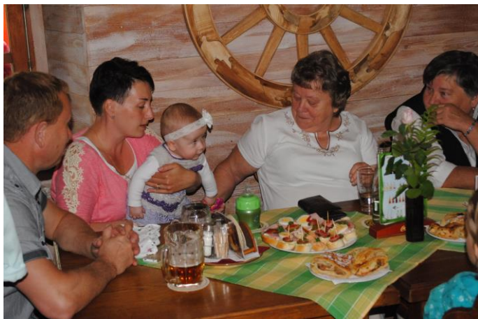
U Konička bylo zajištěno i bohaté občerstvení