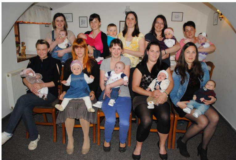
Šťastné maminky se svými ratolestmi