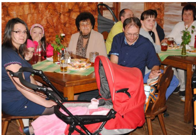
Meziročně se ve Vojkovicích narodilo deset dětí