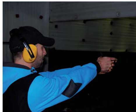
Momentka ze střelby z pistole ráže 9 mm