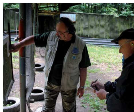
Nad regularitou soutěže bděli přísní rozhodčí