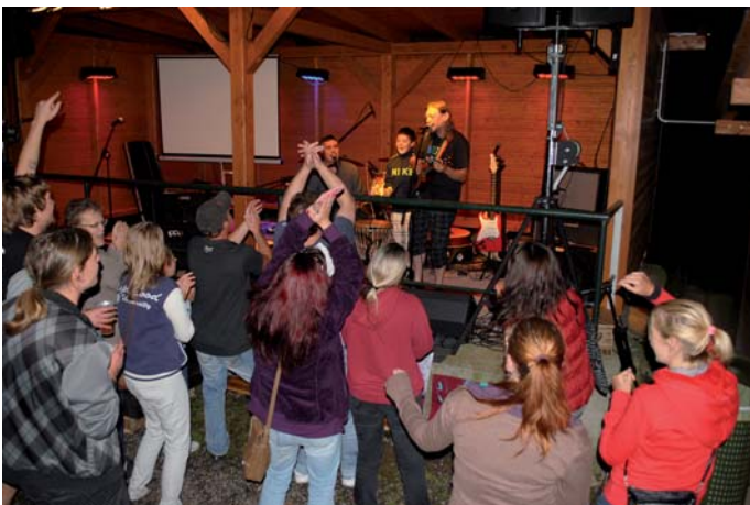
Lidé se baví při zpěvu René Součka