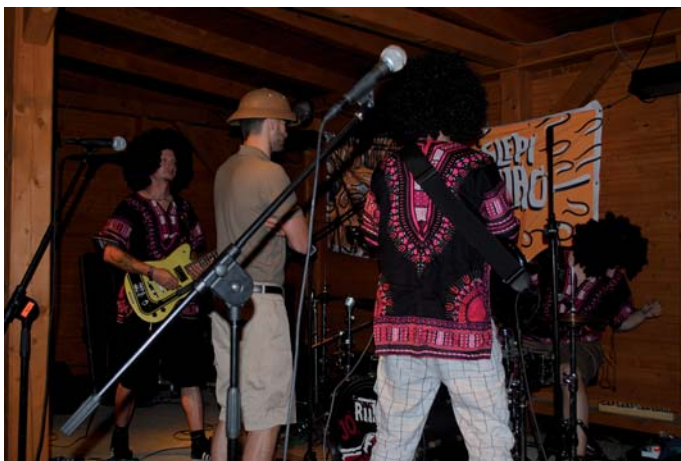
Slepí křováci se chystají na koncert