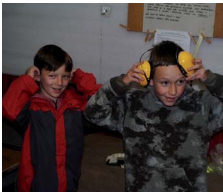
Bezpečnost a ochrana zdraví byly na prvním místě