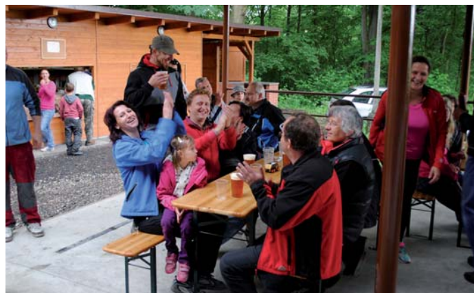
Vítězové jednotlivých disciplín si vyslechli i bouřlivé ovace fanoušků