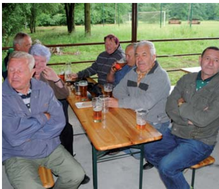
Svůj tým sestavili i vojkovičtí důchodci