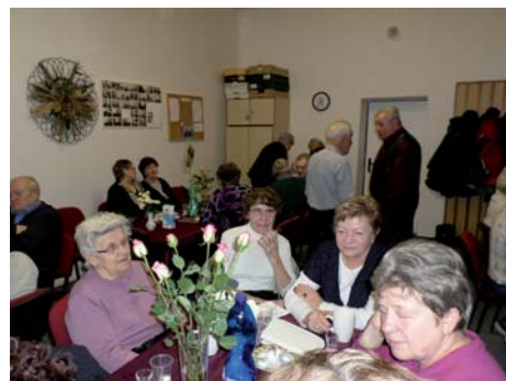
Oslava Mezinárodního dne žen v klubovně klubu našich seniorů