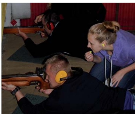
Rekreačním střelcům bylo potřeba občas poradit, jak na to