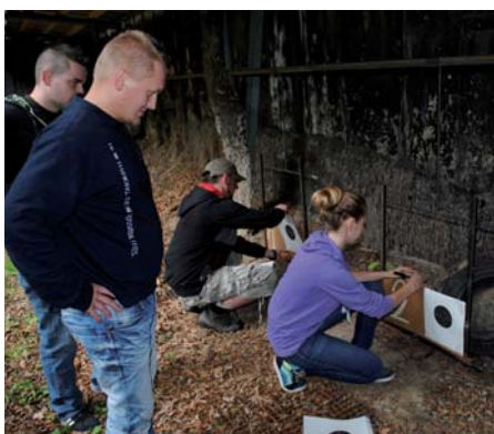
Měření výsledků střelby z malorážní pušky