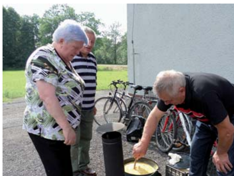
Tradiční smažení vaječiny