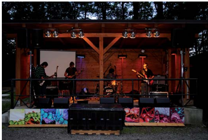
Úvodní vystoupení pod taktovkou kapely Jakoby Nic