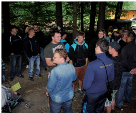
Změřit síly přišli místní i přespolní

XV. ročník Velké ceny Vojkovic o putovní pohár Obecního úřadu Vojkovice ve střeleckém víceboji se konal 14. června 2014 od 9 hodin na sportovní střelnici vedle vojkovického „výletišťe“. Letošní ročník soutěže, které se mohli účastnit pouze neregistrovaní střelci, resp. střelci bez zbrojního průkazu, si nenechal ujít rekordní účast téměř 90 lidí. Celkové vítězství jak v družstvech, tak v jednotlivcích si odnesli Vojkovjané. Soutěž pořádal Svaz branně-technických sportů Vojkovice.