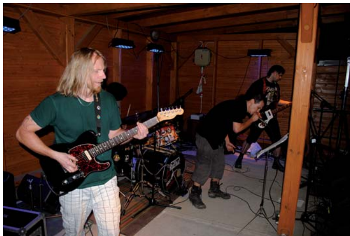
Po půlnoci zněl Vojkovicemi tvrdý hardcore. Ještě že máme tolerantní občany. . .