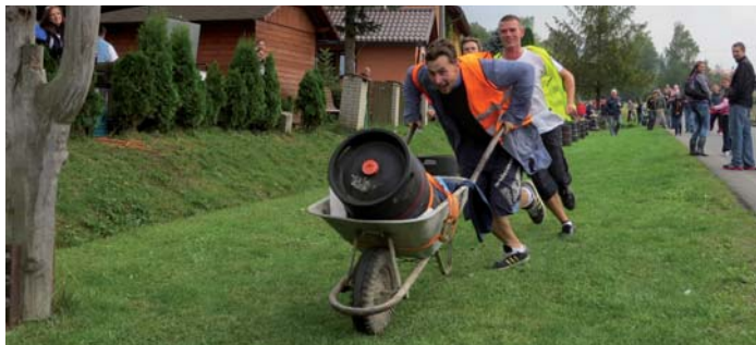
Momentka z minulého ročníku