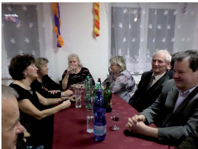
Momentka z Papučového bálu