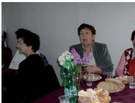
Na oslavě Dne matek se hodně zpívalo