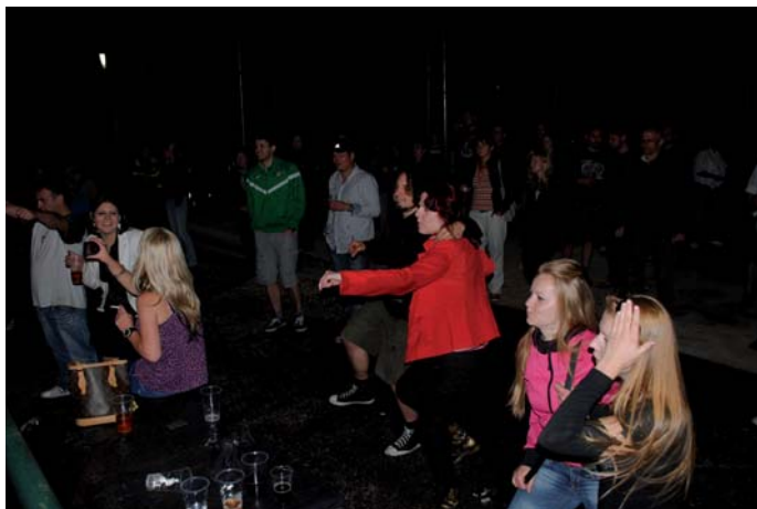
Tanečníci mohli jako jedni z prvních vyzkoušet rekonstruované prostory výletišť