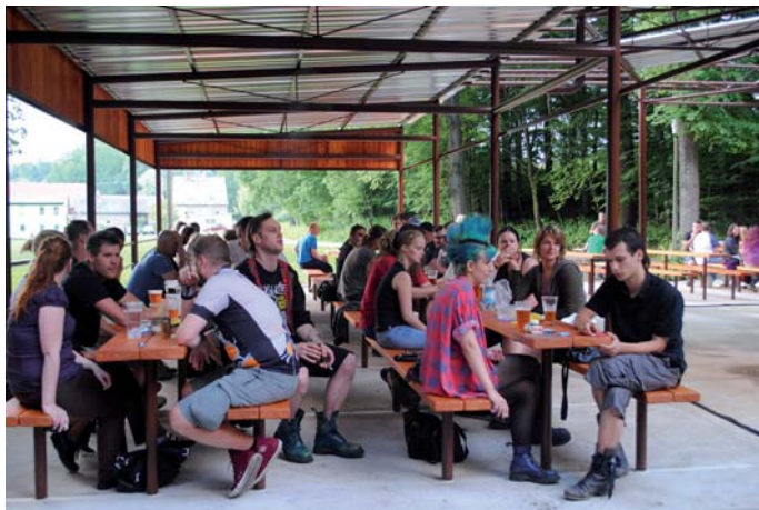
Nultý ročník festivalu Výkvět si nenechalo ujít více než 110 fanoušků náročnější a pestré hudby