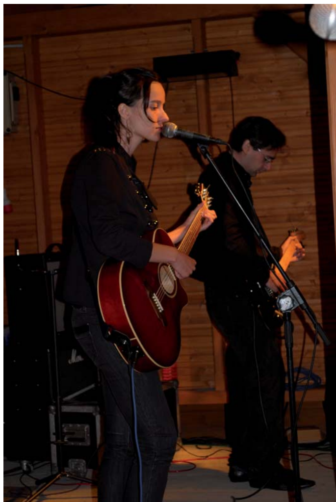
Na festivalu Výkvět nemohla chybět ani hudebnice