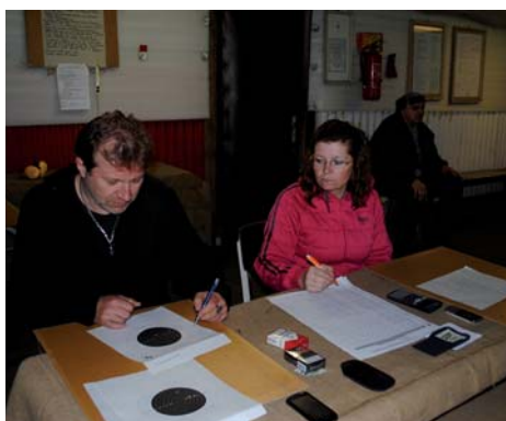
Nakonec bylo potřeba vše dobře spočítat