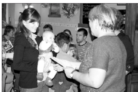
Meziročně se obec Vojkovice rozrostla o 13 dětí