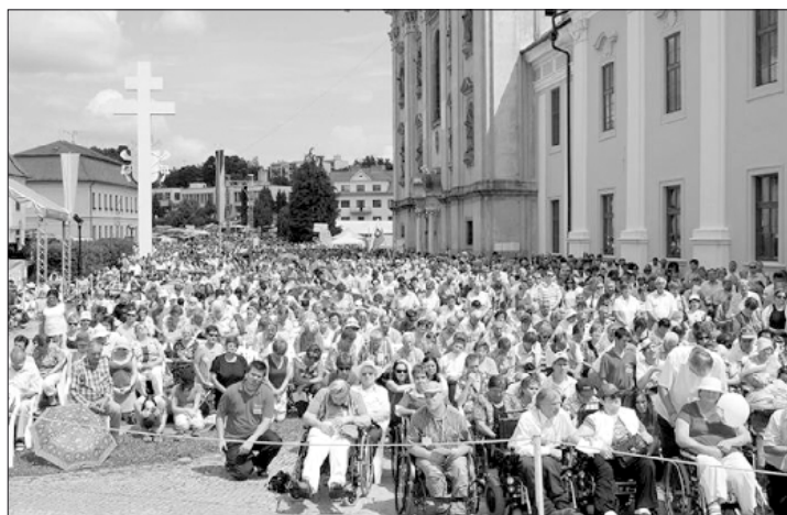
Snímky z uplynulých poutí do Velehradu