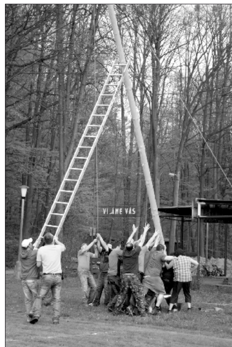
Byla použita nejmodernější zdvihací technika