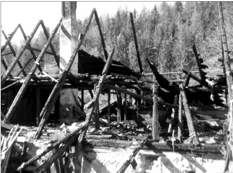
Následky topení nevhodným palivem - ilustrační foto

Důvody, proč spotřebič nemá dostatek vzduchu ke spalování, jsou v podstatě dva. Tím základním bývá skutečnost, že do místnosti, ve které je spotřebič umístěn, není zajištěn dostatečný přívod venkovního vzduchu. Ten má být přitom přiváděn ve stejném množství, jaké se při spalování paliva spotřebuje. Dalším možným důvodem je špatně fungující spalinová cesta. Ta by měla zajistit, aby celým spalovacím procesem prošlo právě potřebné množství vzduchu.