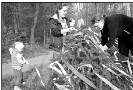
Mája je potřeba krásně ozdobit

Mája byla následně setnuta v sobotu 25. května u příležitosti přátelského fotbalového utkání FC Koniček vs. FC Bar. Utkání skončilo podle oficiálních pramenů 5:5, kdy hráči FC Koniček mohutně finišovali a stáhli za pár posledních minut utkání několikabrančovou ztrátu. Podle neoficiálních a neověřených zpráv vyhráli hráči FC Bar 6:5 gólem Miroslava Jungy, jehož sólová akce byla tak rychlá a střela měla takovou razanci, že míč v brance zaznamenal pouze velice nepřesný rozhodčí.