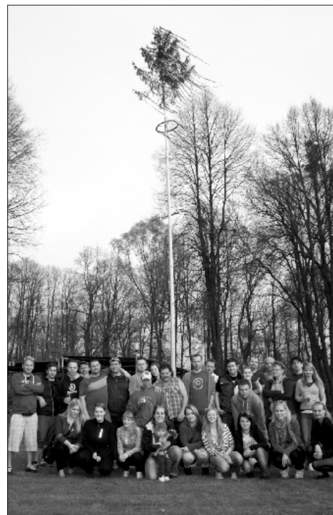
Společná fotka účastníků Slavnosti stavění máje 2013