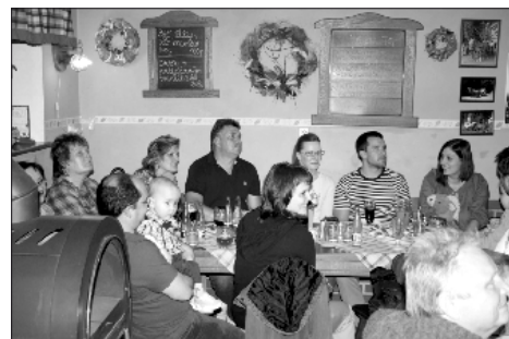
U Konička bylo narváno