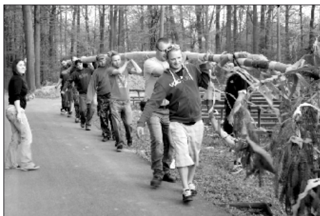
Jde se na věc