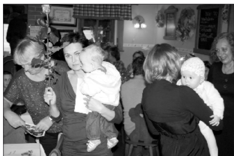
Letošní vítání občánků se konalo v restauraci U Konička