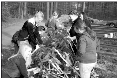
Zdobení máje mají tradičně na starosti nezadaná, svobodná děvčata (tuto část tradice se ve Vojkovicích nedaří naplňovat)