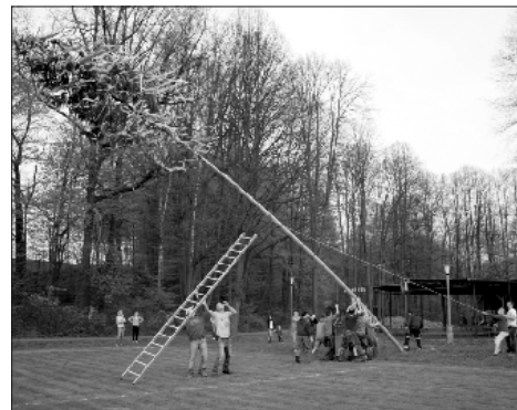
Úchvatná podívaná začíná