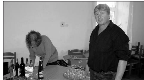
Jak je vidět, nechybělo vůbec nic.