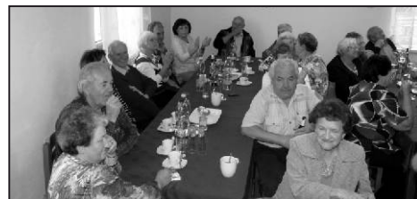
Zábava probíhala do pozdního odpoledne.