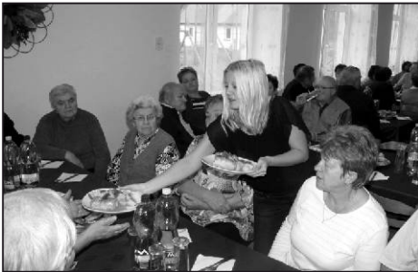
Na úvod akce je potřeba se dobře občerstvit.

Následoval společný oběd, po krátké informaci o plánech Klubu do konce roku pak začala zábava. Při dobré muzice se naši důchodci bavili do pozdních odpoledních hodin.