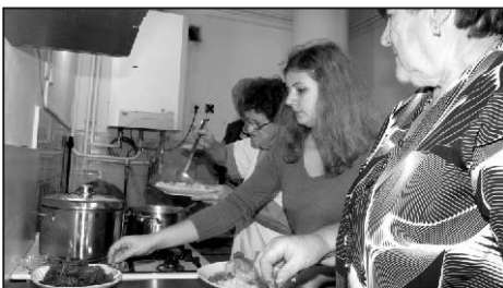
Pohled do kuchyně.