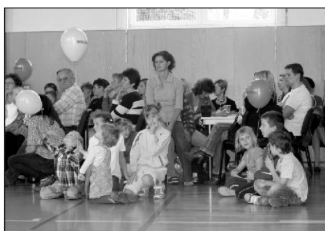
Slavnostní otevření tělocvičny si nenechaly ujít desítky lidí.