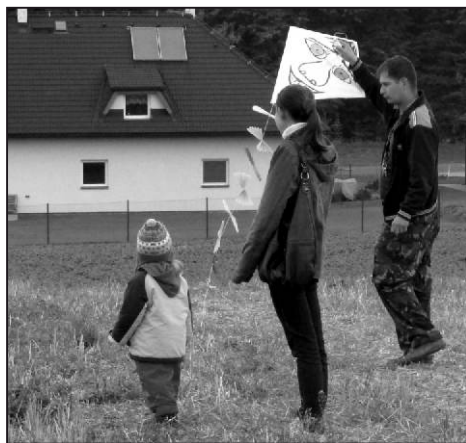
Ručně vyráběných draků bylo poskromnu.

Drakiádu uspořádal Společenský klub Vojkovice (SKV), který pro všechny děti, které přišly se svými vlastnoručně vyrobenými nebo koupenými draky, připravil horký čaj a pár sladkostí. Pro jejich dospělý doprovod pak bylo k dispozici svařené víno nebo vařenka. Tyto nápoje přišly v chladný podzimní večer vhod. Fotografie z letošní vojkovické Drakiády jsou ke stažení na facebookových stránkách SKV - http://www.facebook.com/media/set/?set=oa.428212790571835&type=1