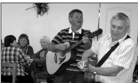
I díky muzikantům bylo veselo.