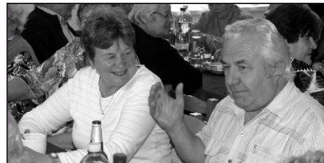
Naši starší spoluobčané si mají stále co říci.