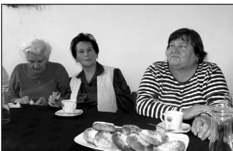
K výborným koláčkům....