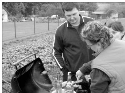
Chladný podzim se dal, díky hřejivým lektvarům z prověřených zdrojů, vydržet.