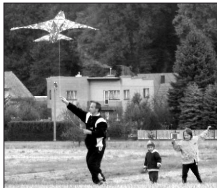
Bojový letoun nad Vojkovicemi.