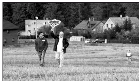
Drakiáda je zábavou i pro dospělé.