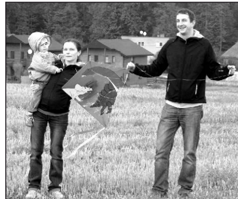
Drak - dinosaur se ve vzduchu dlouho neudržel.