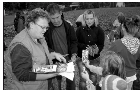
Ovládat draka není snadné, děti si sladkou odměnu za svůj výkon zasloužily.