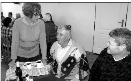
... patří dobrá kávačka