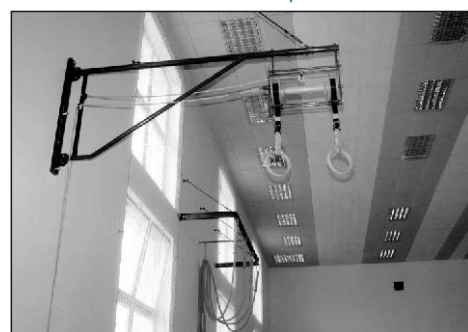
Tělocvična má vše, co by měla správná tělocvična mít.