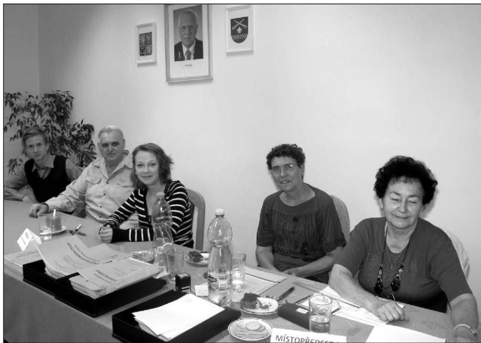
Členové volební komise