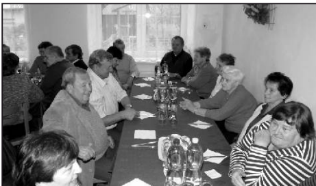
Členové klubu důchodců Vojkovice se na akci dobře bavili