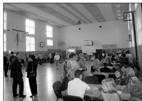
Prostory jsou vhodné pro mnoho druhů sportů.