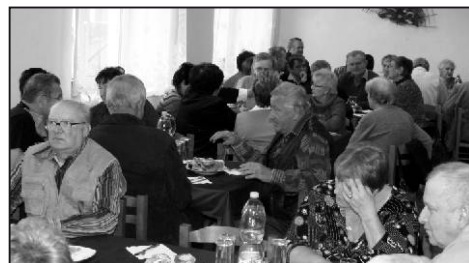
Zaplněný sál v budově bývalé obecní školy.