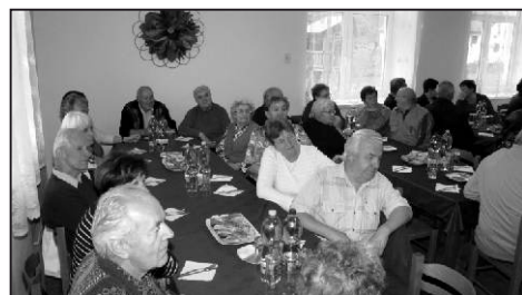
Setkání důchodců se zástupci obce přilákalo desítky občanů.