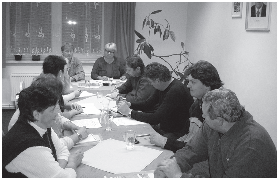
Momentka z 2. veřejného zasedání zastupitelstva obce Vojkovice.