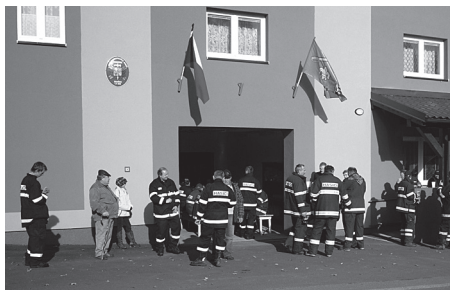
Výjezd na námětové cvičení před rekonstruovanou hasičskou zbrojnicí

se díky tomu rozšířila o další prostory, především šatny. Bylo potřeba udělat novou podlahu ve schůzovací místnosti, dále vyměnit zárubně, koupit a usadit nové dveře, doplnit tři nové radiátory, opraveny jsou i schody a rekonstruována je i montážní jáma na opravu techniky. Obecní úřad poskytl hasičům židle a stoly. V letošním roce se „zbrojní“ park našich hasičů rozrostl o motorovou pilu s příslušenstvím. Dva z hasičů absolvovali specializovaný kurz. „Spolupráce vedení obce a SDH je příkladná, vycházejí nám plně vstříc. Ještě bychom potřebovali dva zaškolené lidi na pilu, poptávka po práci s pilou je velká, ať již v případě pádů stromů na silnici nebo obydlí. Vždyť ještě nedávno naše obec musela požádat o pomoc sousední Dobruška,“ říká B. Voznica.