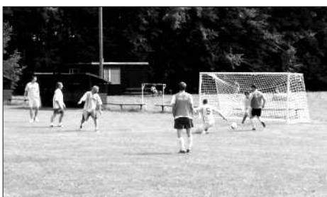
... pořádný náprah a rána...