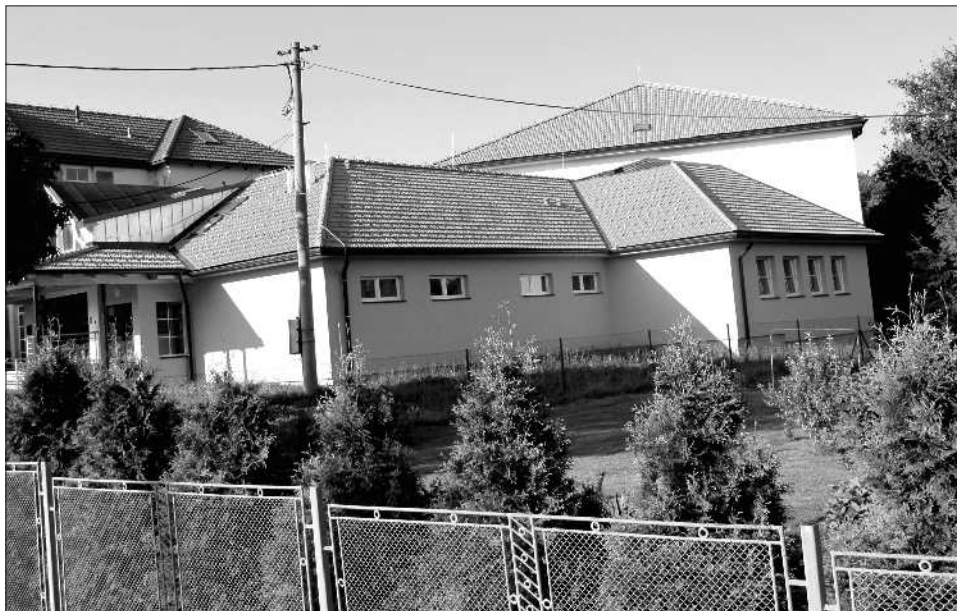
Nový objekt školy v Dobratcích pod Prašivou