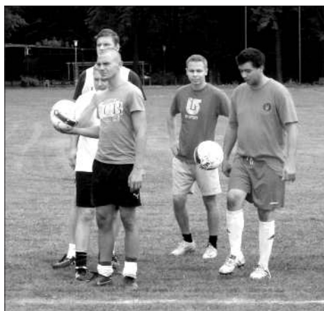
Pohoda týmu Vojkovice B před zahájením turnaje se záhy přenesla i na hřiště a o vítězství nebylo pochyb