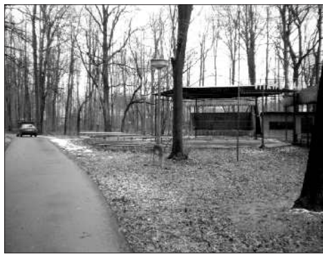
Stav výletišť na začátku roku 2012