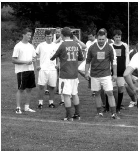
Týmy minipivovaru Koníček. Bojovný výkon milovníků kvasnicového piva na nejlepší nestačil, tým „A“ (bílé) skončil čtvrtý, tým „B“ na pátém místě.

byla rozdělena na Vojkovice A a B, Koníček A a B a Stará garda (vzhledem k tomu, že se klíčoví a věkem zkušenější hráči tohoto týmu nedostavili a za tým nakonec museli nastoupit i hodně mladí kluci, byl tým přejmenován na přesnější „Občané“).