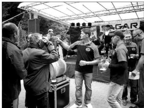
Koníčkův den začal naražením dřevěného sudu

Slavnosti odstartovaly naražením dřevěného sudu, přičemž prvních sto pív se vyčepovalo účastníkům zdarma, a to přes několik desítek starou klasickou pípu. Milovníci zlatavého moku mohli vyzkoušet i nápoje z jiných měst, ať již šlo o kvasnicová nepasterizovaná piva z minipivovarů Qvásek z Ostravy, Rohan z Rohova, nechyběl dokonce 15 litrový vzorek piva z bavorského minipivovaru a mnohá další.