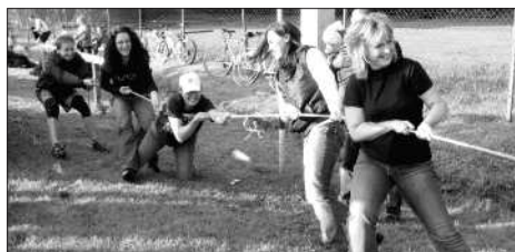
Vrcholem akce byla soutěž v přetahování lanem. Na snímku ženské finále. Muž vzadu, který se mezi sličné bojovnice vmísil, byl záhy odehnán pořadateli