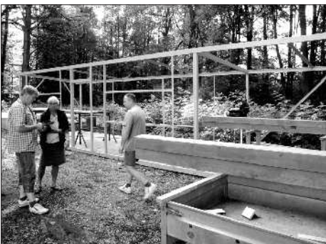
Starostka a místostarosta obce na „kontrolním dnu“ - srpen 2012