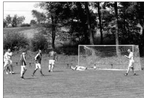
... ten, nic nenahradí ti