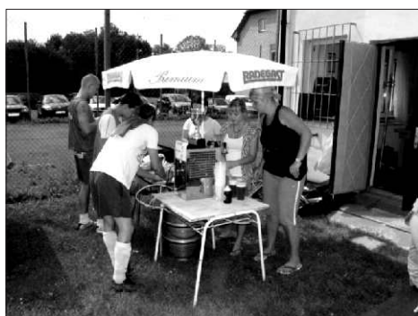
Pivo a párek, občerstvení zajištěno