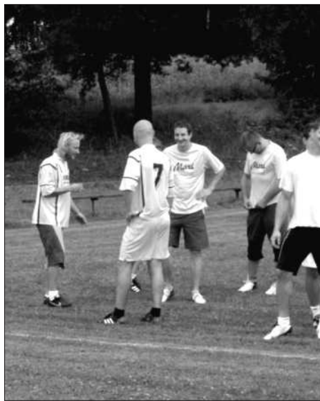
Někteří z týmu narychlo sestavených „Občanů“ se evidentně nemohli vejít do dresů, nakonec však senačně obsadili druhé místo a stali se překvapením turnaje!

Organizátoři děkují všem partnerům, sponzorům akce a těm, kteří pomohli, a věří, že se akce stane tradicí.