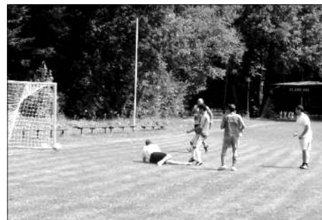
... moment, kdy míč třepetá se v síti...