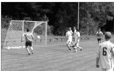
Góóó! To je úžasná věc...