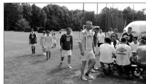
Je dobojováno a hurá do sprch!