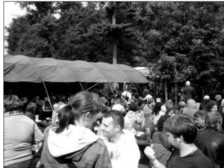
Cestu do vojkovického pivovaru si našly davy lidí

K dobrému pití patří i dobré jídlo, které bylo možné zakoupit v několika stáncích a uvnitř hostince. O překvapení odpoledne se postaral maďarský sportovec, který do náhodou Vojkovic zavítal. Svalově vybavený borec, člen reprezentačního týmu maďarských zápasníků (jméno jsme bohužel nezaznamenali, protože jsme maďarsky moc nerozuměli) zvedl ze země a udržel 50litrový plný sud piva nad hlavou více než 30 sekund, resp. udržel by déle, ale poté, kdy se začal se