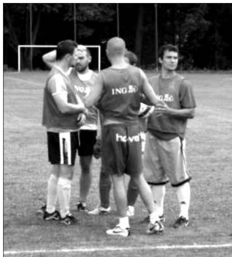
Vojkovické „áčko“ obsadilo díky tréninkovému tempu ke konci turnaje až třetí místo