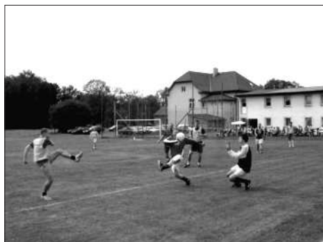
Hráči se předháněli v nasazení a bojovnosti, hlavně z počátku turnaje.