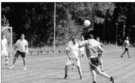
Turnaj proběhl za nádherného a teplého, leč vysilujícího počasí.