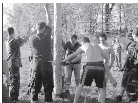
Vojkovjané si to svoje hlidají velice tvrdě. Ocelové pletivo zabráni choutkám agresorů z okolních vesnic