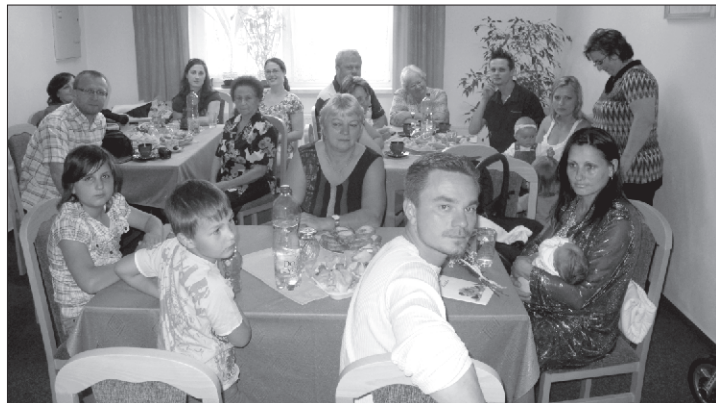
Na vítání nových občánků přišli do budovy Obecního úřadu nejen rodiče, ale i babičky, dědečkové, prababičky a další