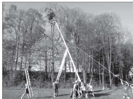
„Nejmodernější zdvihací technika“ nemohla chybět