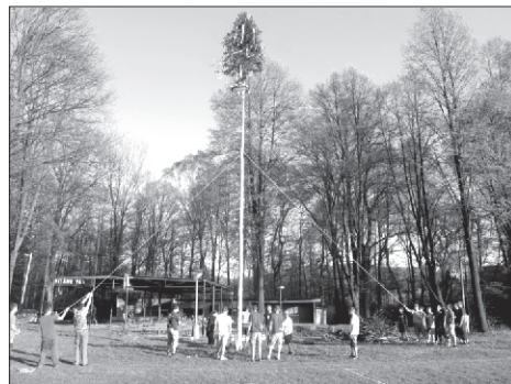
Vojkovice mají opět jednu z nejkrásnějších májek v regionu