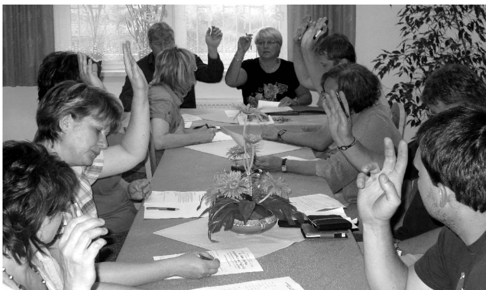
Snímek ze zasedání zastupitelstva - ilustrační foto

Starostka seznámila zastupitele s předmětem smlouvy. Jedná se o software mapové podklady k.ú. Vojkovice za celkovou cenu 8 400,- Kč včetně DPH. Zastupitelé smlouvu schválili a pověřili starostku podpisem.