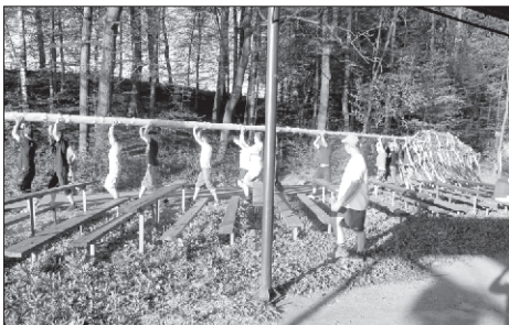
A jde se na věc