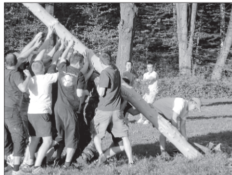
Je potřeba překonat bod zlomu