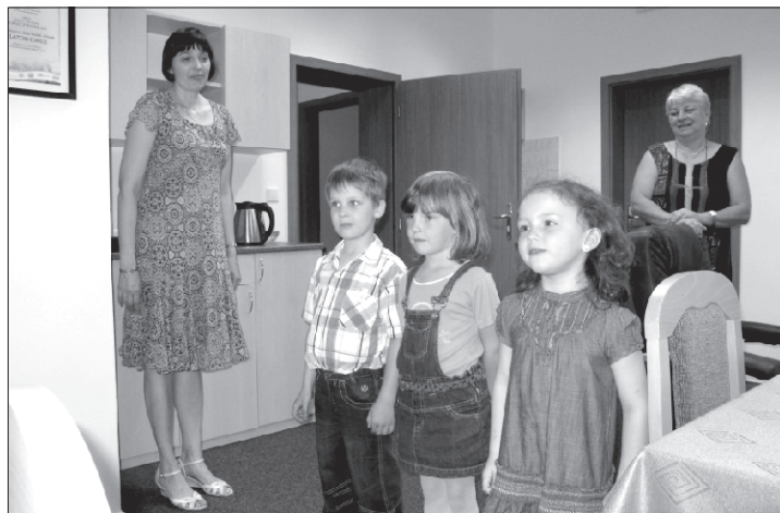
Svým malým spoluobčánkům přišly popřát děti z naší mateřské školy