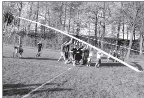
Nejtěžší fáze stavění máje