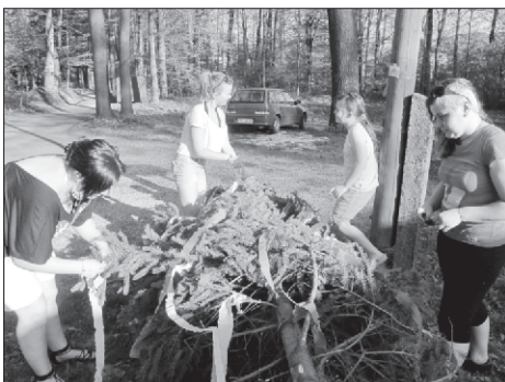
O zdobení se postaraly, podle tradice, svobodné dívky