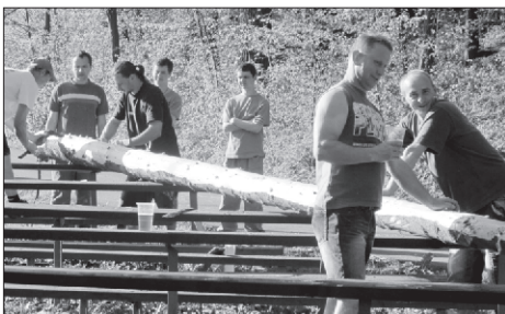
Máju je potřeba zbavit kůry

Ze stavění máje bylo pořízeno i video a ke stažení je na http://www.youtube.com/watch?v=jznCg7FeiwU&feature=youtu.be Určitě stojí za zhlédnutí.