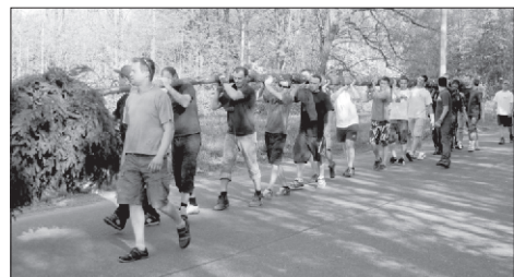
... trpaslící jdou

setkat i s břízou. Vršek májky se zdobí proužky z barevného krepového papíru nebo látek, na máju se zavěšuje také zdobený věnec, případně (jako letos ve Vojkovicích, lahvinku na zahřátí). Májka se kácí vždy na konci května. Existovaly i malé ozdobené májky, které se již od středověku stavěly za svítání 1. května jako výraz lásky k dívce nebo naopak se stavěla májka před domem svobodných dívek. Někde se v tuto noc vyspávaly cestičky zamilovaných dvojic. Mnohdy tak vyšlo najevo to, co mělo být skryto ostatním. To pak bývalo „veselo“... Další obdoba malování je ta, že se nad rámem 1. května objeví na silnici před domem vápnem napsaný (vesničany schválený) v žertovné podobě vystihující nápis. Například před radnicí: „Tady je starostovo“ nebo „Kocourkov“ a podobně.