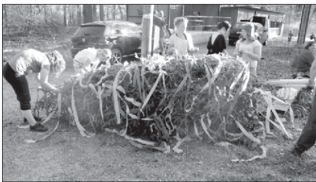
Krepový papír proměnil špičku máje v umělecké dílo