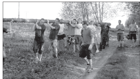
Hej hou, hej hou...