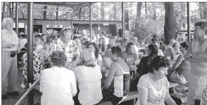
Snímek z loňského ročníku Vojkovického dne

Stejně jako loni je v průběhu odpoledně na programu vystoupení vojkovických kynologů, ukázka zásahu místních hasičů, seskok parašutistů, ukázka produktů místních včelařů. Po celý den bude k dispozici bohaté občerstvení ve stylu slezské kuchyně (gril, uzené maso, koláče...). Večer proběhne taneční zábava a soutěž v hodu sudem do dálky o ceny. U příležitosti setkání obcí Vojkovic bude uvařeno speciální kvasnicové pivo Vojkovjan a Vojkovjanka z dílny minipivovaru U Konička. V průběhu celého dne soutěže pro děti i dospělé.