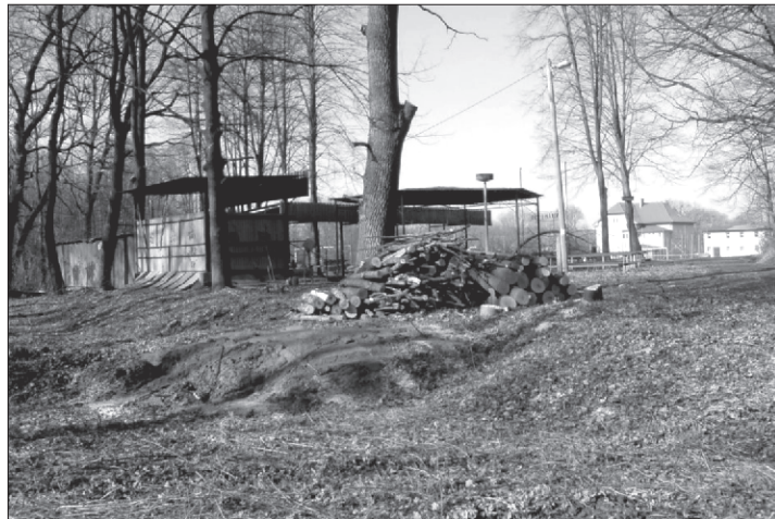
Příprava na zahájení rekonstrukce výletišť v plném proudu

Rekonstrukcí však konečně projde naše „výletišť“. Postaví se nové sociální zařízení, resp. ono žádné ani nebylo, ... terénní úpravy, rekonstrukcí projdou plechové boudy. V plánu je i nový „udák“. Podle starostky jde z celkového pohledu o zdařilý architektonický projekt. Přípravné práce již začaly a to kácením stromů,