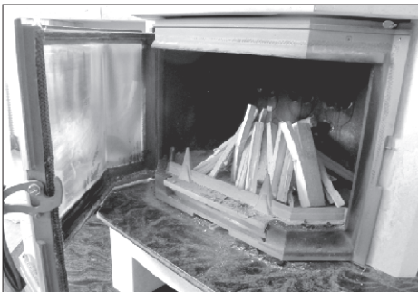
Krbové vložky jsou velmi oblíbené

u spotřebičů na pevná paliva zajistit kontrolu spalinové cesty, a to 1 x ročně, kterou rovněž provádí kominík. Při kontrole spalinové cesty se provádí např. posouzení bezpečného umístění hořlavé stavební konstrukce, materiálu a předmětu ve vztahu ke konstrukčnímu provedení spalinové cesty a připojeného spotřebiče paliv, kontrola průstupů spalinové cesty stavebními konstrukcemi, půdním prostorem nebo střechou a vůbec posouzení stavebně technického stavu spalinové cesty. O provedené revizi, čištění nebo kontrole spalinové cesty musí kominík vyhotovit písemnou zprávu.