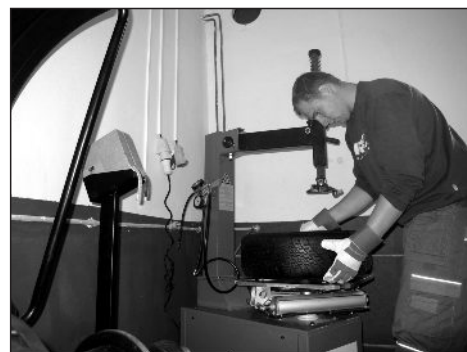
Celkové přezutí vyjde na 450 korun