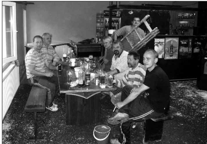
Do prací se zapojilo více než 30 lidí. Občerstvení na závěr přišlo vždy vhod