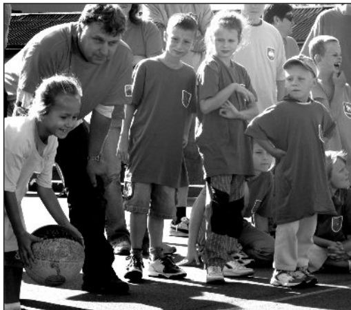
Hod na kuželky