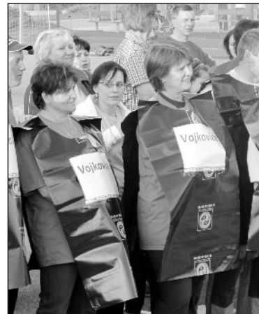
Příprava na hod vejcem (syrovým)