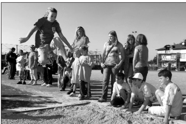
Skok do dálky, aneb skok geparda