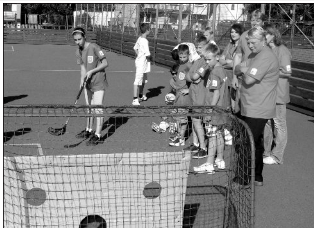
Střelba na branku