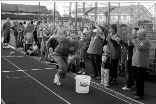
Štafetový běh „dospěláků“