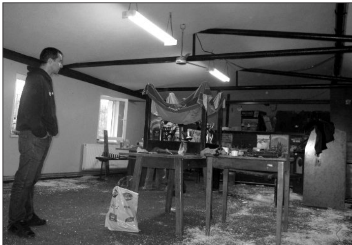
Takto to vypadalo v baru Na hřišti v době oprav