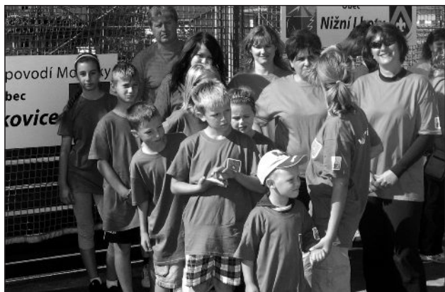
Soutěžní tým s doprovodem