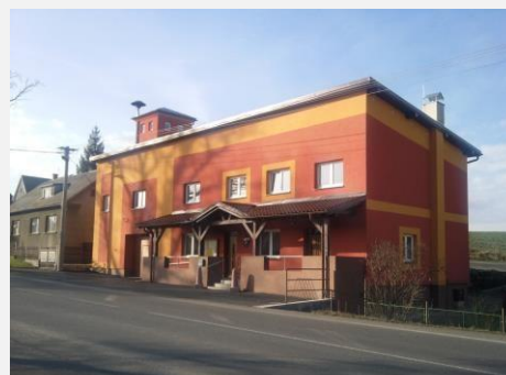
Obecní úřad ve Vojkovicích