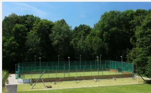
Sportovní hřiště v Dobraticích

Od března 2018 Centrum společných služeb rozšířilo své služby o poskytování poradenství v oblasti ochrany osobních údajů a zajištění Pověřence pro ochranu osobních údajů (DPO) pro členské obce a