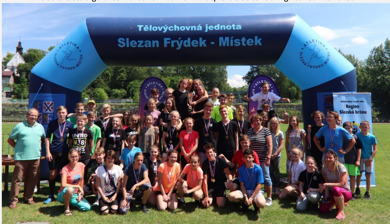
Vítězné družstvo Šanova na lehkooatletických závodech 2. stupně ZŠ na slezanském stadionu ve Frýdku