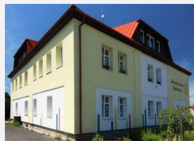
Základní škola v Dobratcích

Název obce vychází nejspíše z vlastního jména Dobrata. První písemná zmínka o obci pochází z doby okolo roku 1580. Vesnice byla založena v rámci rozšiřování vrchnostenského hospodářského zázemí, kdy místní osadníci sloužili při nově založeném panském dvoře, mlýně a ovčinci. Mezi místní pamětihodnosti patří kostel sv. Filipa a Jakuba menšího vysvěcený roku 1865 s vlastní farou od roku 1868. Škola byla v Dobratcích založena roku 1852 napřed s výukou v pronajaté chalupě a od roku 1871 ve vlastní budově. Od roku 1888 byla zprovozněna také železnice na trase Frýdek-Těšín, název Dobratice pod Prašivou nese zastávka ve Vojkovicích od roku 1958. Nejstarším místním spolkem byl Dobrovolný spolek hasičů založený roku 1927. Dobratice byly v roce 1938 zabrány Polskem a za německé okupace připadly k Německé říši. Po válce byly Dobratice samostatné až do roku 1980, kdy byly spojeny s Dobrou a nově osamostatněny byly až roku 1991. V obecním znaku je na modrém poli zlatý pluh, který se poprvé objevil už na nejstarší pečeti obce a odkazuje na zemědělskou minulost a také je tady buková ratolest, která odkazuje na dříve samostatnou ves Bukovec, která se stala součástí Dobratice roku 1850.