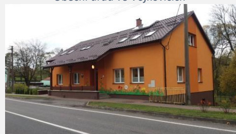
Budova Mateřské školy ve Vojkovicích