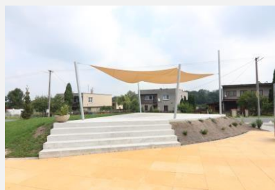
Centrum obce Dobratice