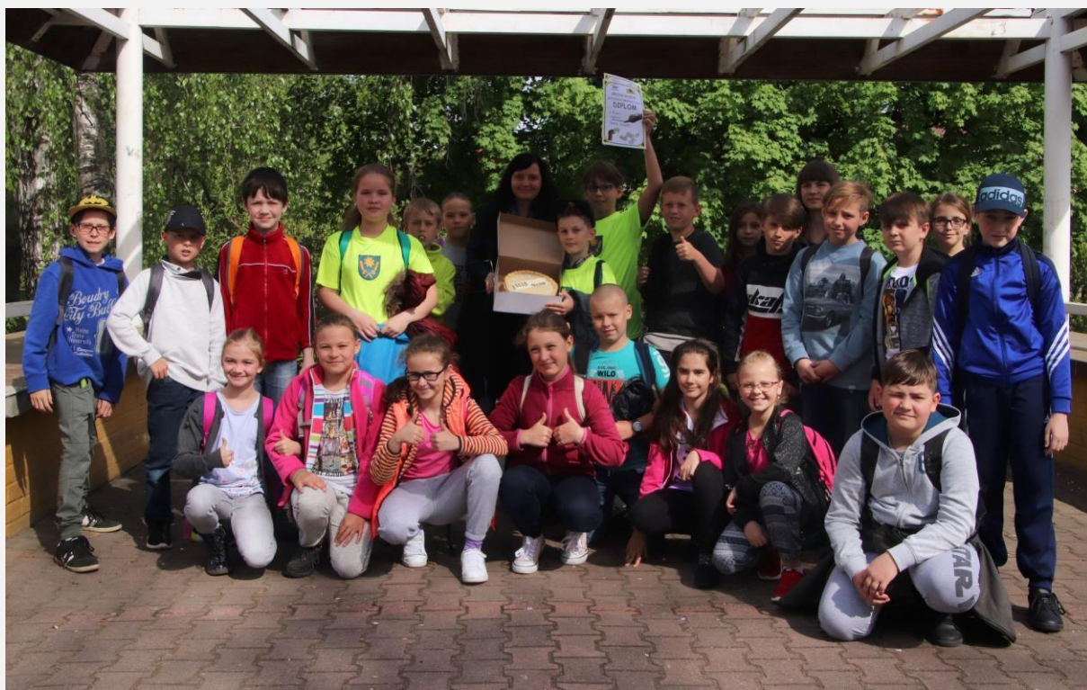
Vítězné družstvo vědomostní soutěže v kategorii žáků 1. stupně - ZŠ a MŠ Václavovice

Také proto se připravuje cyklus sportovních a vědomostních soutěží pro stejné kategorie na školní rok 2018/2019. S řediteli škol bude projednán tentokrát již před vlastním zahájením školního roku, tj. v tzv. přípravném týdnu na konci srpna. Předpokládá se opět 7 sportovních akcí a samostatná vědomostní soutěž. U vědomostní soutěže budou hledány zdroje pro financování, a to alespoň části nákladů, zapojením této aktivity do projektu Místní akční plán II.