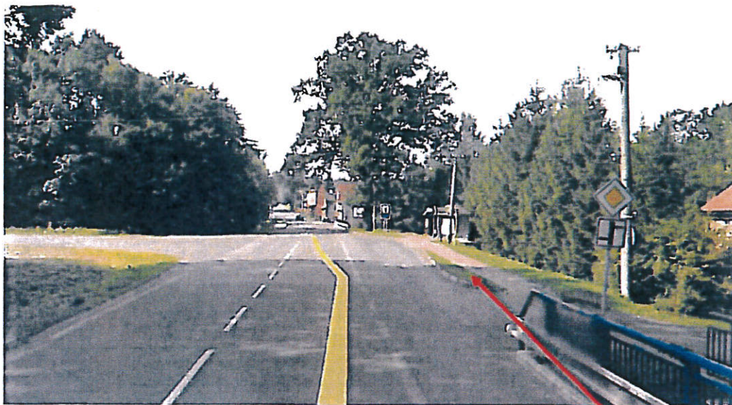
Příloha č. 2 – Situace B

Směrová tabule s jiným cílem – symbol č. 302, směr přímo, „PZ Nošovice“ + tabulka pro odbočení vlevo s přeškrtnutím GPS